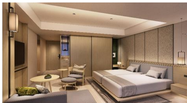
ホテル客室イメージ (禅タイプ)