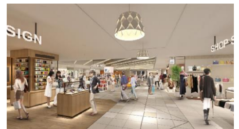
2階：内観イメージパース