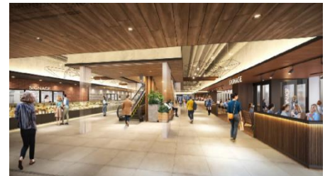
1階：内観イメージパース

好奇心に待ったをかけず、生活を楽しく。 何気ない日常を豊かに満たし、リアルな生活を充実させたい。 しあわせの循環を生み出す存在でありたい。