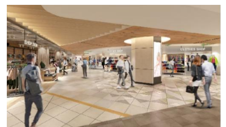
3階：内観イメージパース