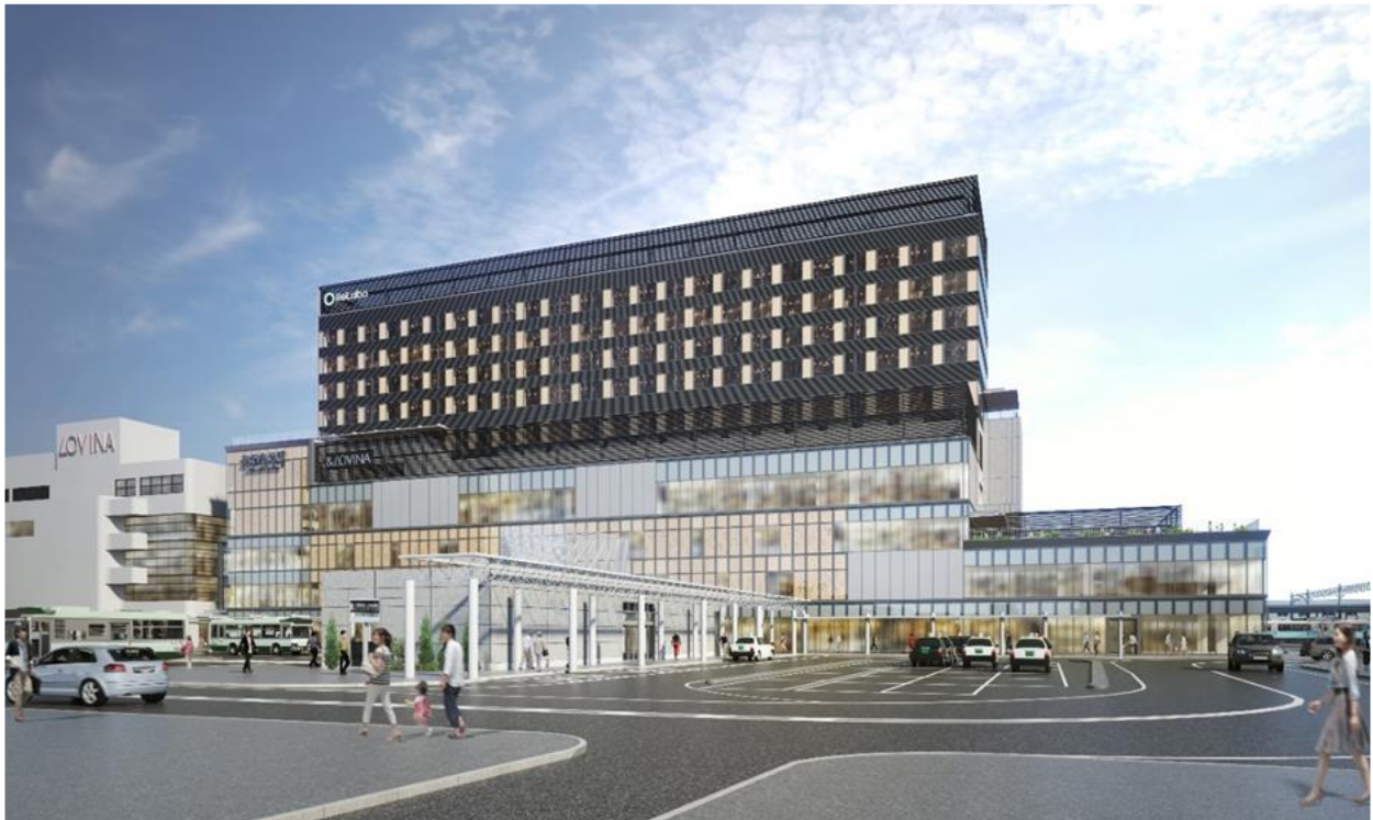
外観 イメージパース